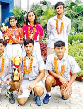
सोनीपत। लिटल एंजल्स स्कूल के विजेता खिलाड़ी साथ में प्राचार्या।

सोलन के दुर्गा पब्लिक स्कूल में आयोजित सीबीएसई नॉर्थ जॉन लॉन टैनिंस चैंपियनशिप में लिटल एंजल्स स्कूल, सोनीपत के लॉन टैनिंस खिलाड़ियों ने 8 स्वर्ण पदक जीतकर अपने विद्यालय व राज्य का नाम रोशन किया। इस चैंपियनशिप में अंडर-17 बालक वर्ग के फाइनल मैच में लिटल एंजल्स स्कूल, सोनीपत की टीम ने दुर्गा स्कूल, सोलन की टीम को 6-2, 6-2 के सैट स्कोर से हराकर 4 स्वर्ण पदक जीते। इसके साथ ही खालसा एकेडमी, सोलन में आयोजित अंडर-19 बालिका वर्ग में लिटल एंजल्स स्कूल, सोनीपत की टीम ने डी.पी.एस. फरीदाबाद को 6-2, 6-3 के सैट स्कोर से हराकर 4 स्वर्ण पदक जीते। सीबीएसई नॉर्थ जॉन