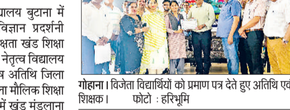
गोहाना। विजेता विद्यार्थियों को प्रमाण पत्र देते हुए अतिथि एवं शिक्षक।