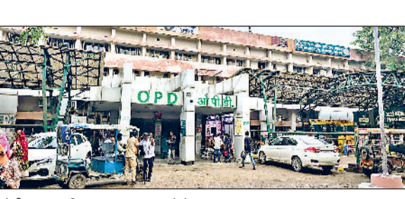
सोनीपत। नागरिक अस्पताल का फोटो।

2019 से अब तक रेफर हुए मरीज ओरल कैंसर : 1090 मरीज सर्वांगिक कैंसर : 2015 मरीज ब्रेस्ट कैंसर : 692 मरीज नोट- इन आंकड़ों से साफ है कि जिले में कैंसर के मरीजों की संख्या वितानुक स्तर पर है।