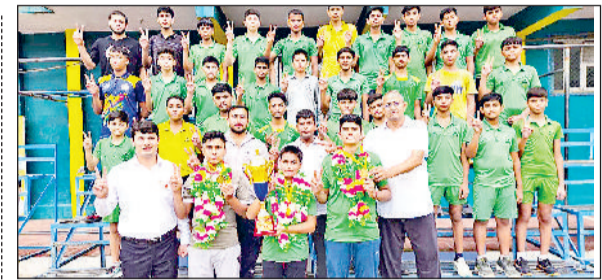
खरखोदा। पदक विजेताओं का स्वागत करते हुए स्कूल प्रबंधन।

गोहाना। विजेता विद्यार्थियों को प्रमाण पत्र देते हुए अतिथि एवं शिक्षक।