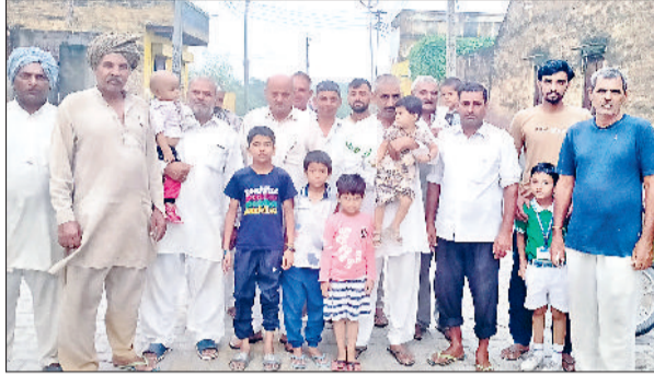
गोहाना। खेतों में पानी भरने से परेशानी गांव धनाना के ग्रामीण व पानी से लबालब भरी हुई ड्रेन।